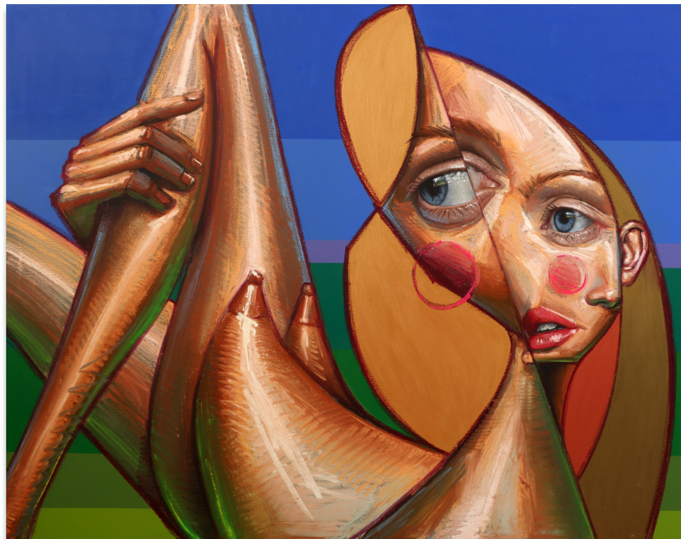
FRANÇOISE 147x117 cm, mixta sobre lienzo