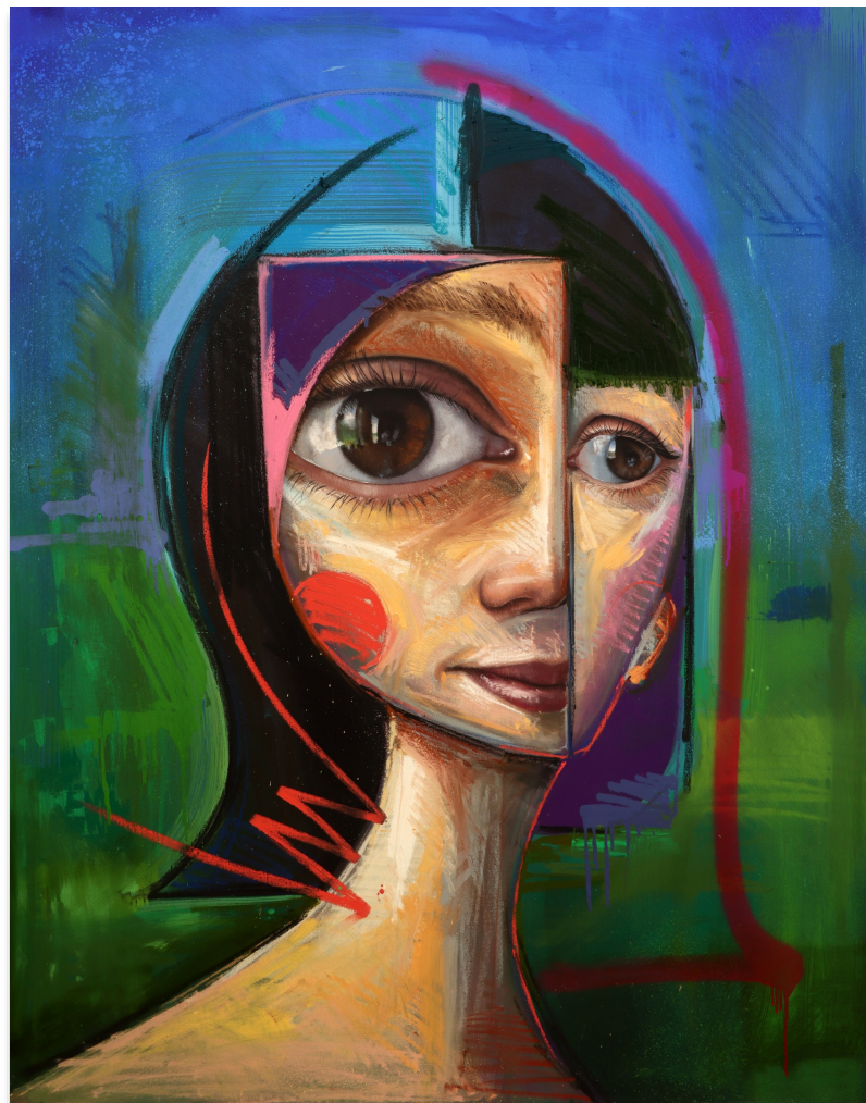
JULIETTE 150x120 cm, mixta sobre lienzo