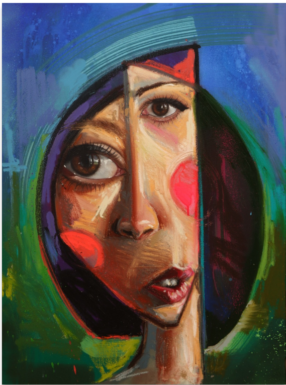
EMILIE 80x60 cm, mixta sobre lienzo