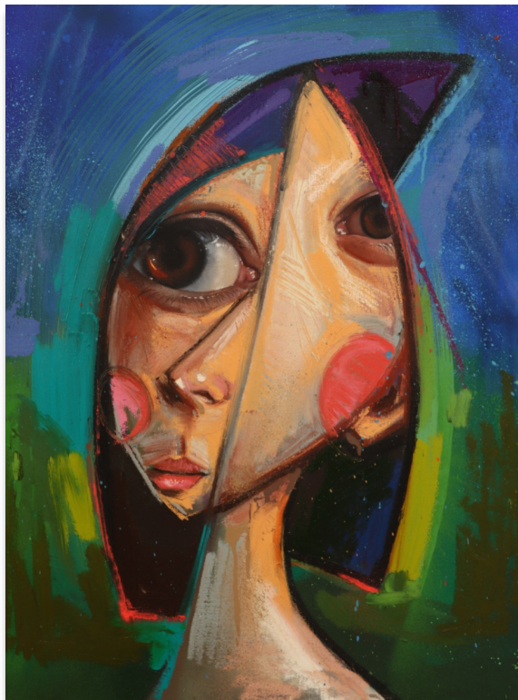
AMÉLIE 80x60 cm, mixta sobre lienzo