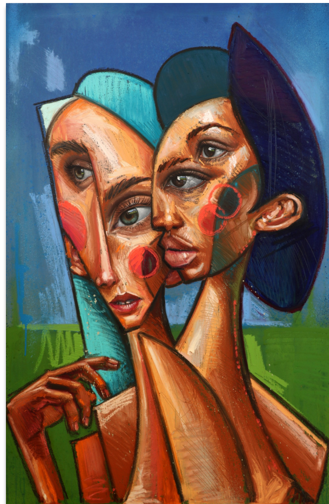
MADELINE Y JOLINE 120x80 cm, mixta sobre lienzo