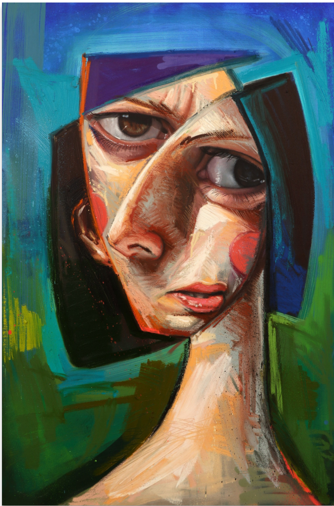
NATALIE 120x80 cm, mixta sobre lienzo