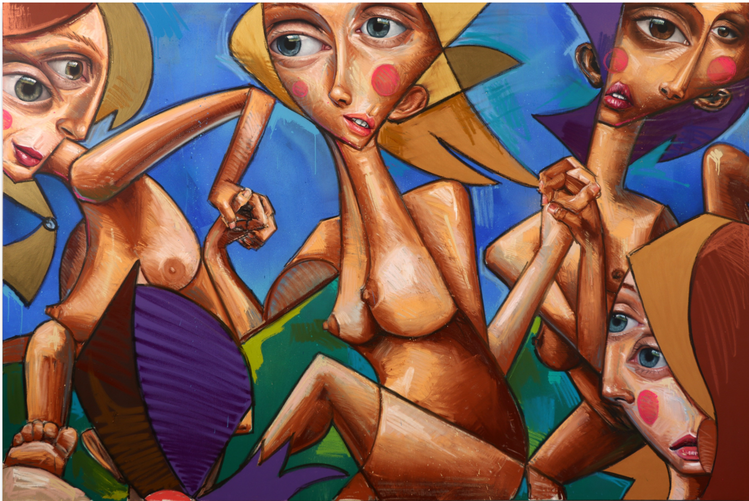
LA DANZA 200x300 cm, mixta sobre lienzo