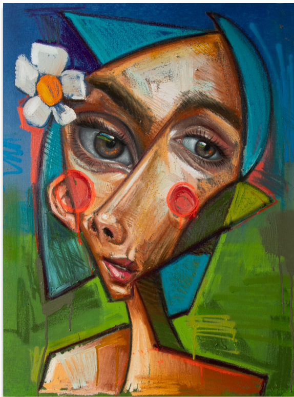
BERTHE 80x60 cm, mixta sobre lienzo