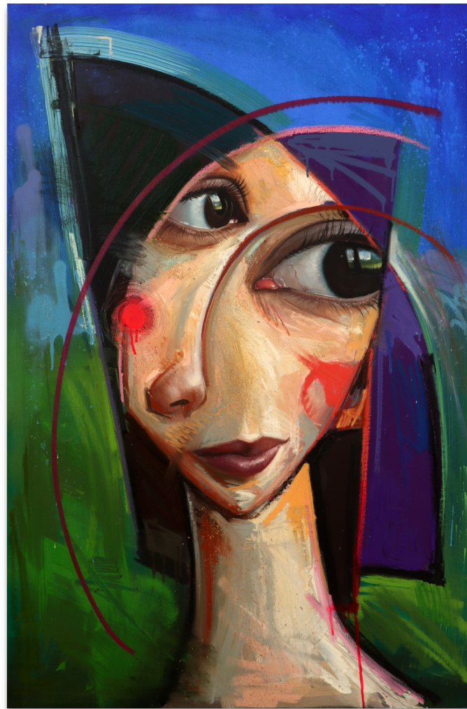
COLETTE 120x80 cm, mixta sobre lienzo