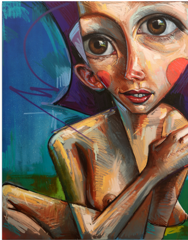
ODETTE 150x120 cm, mixta sobre lienzo